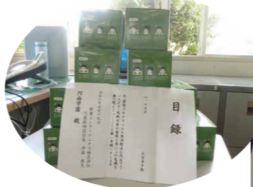
(株)興亜エレクトロニクス様よりいただいたマスク