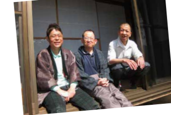
上:豊和寮 下:ビュー柳沢