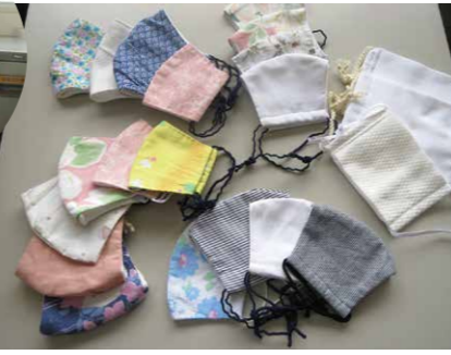
阿南町社会福祉協議会様よりいただいた手作りマスク