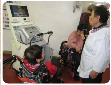
カラオケを楽しみました!

新型コロナウイルス感染症の影響で不自由な生活を強いられておりますが、善意の気持ちも沢山いただいております。阿南町社会福祉協議会様からはボランティアの皆さんの手作りマスクが70枚余り届きました。帰省、面会も自粛していただいているご家族からも届いています。(株)興亜エレクトロニクス様、国・県・阿南町からも届きました。感染症が終息して以前のように、地域の皆様との交流ができる日常に、早く戻れることを楽しみにしながら、沢山の心温まるお気持ちに感謝しております。